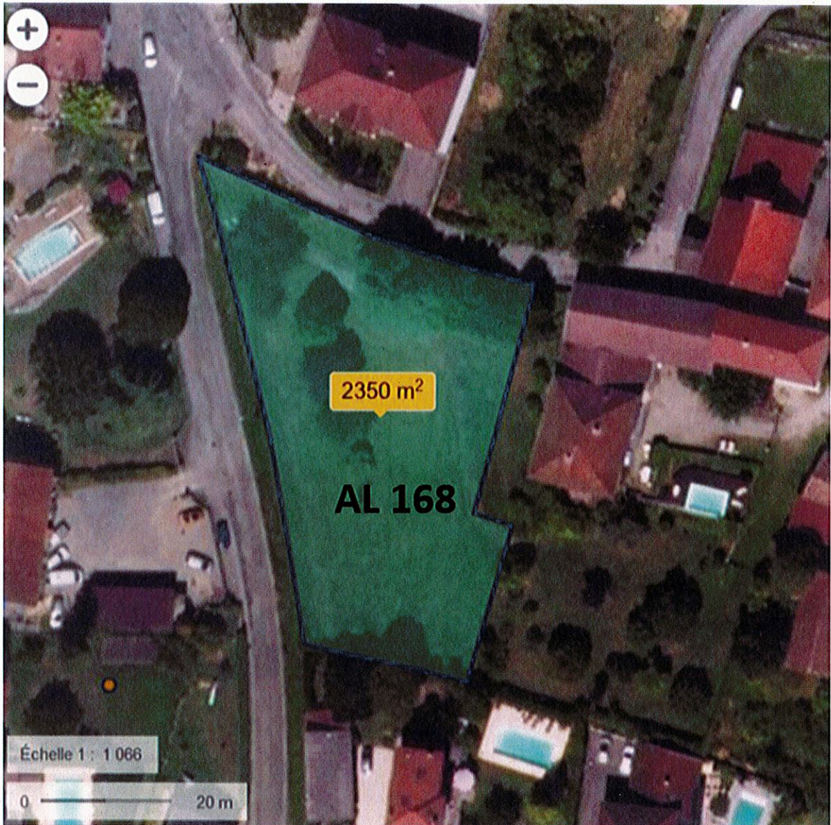
Parcelle AL 168 – Commune de Le Touvet