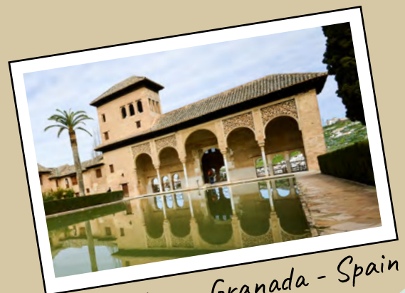
Alhambra - Granada - Spain