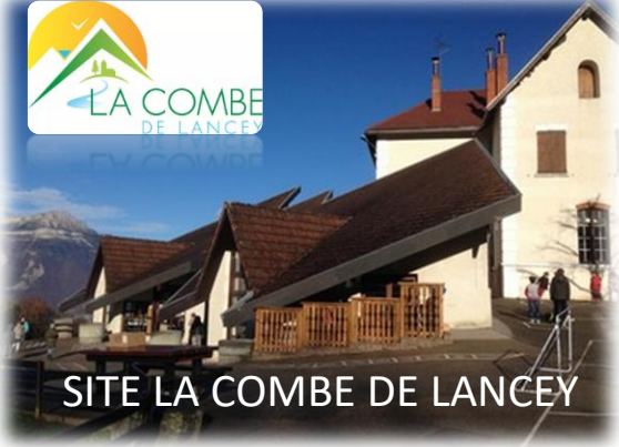
SITE LA COMBE DE LANCEY