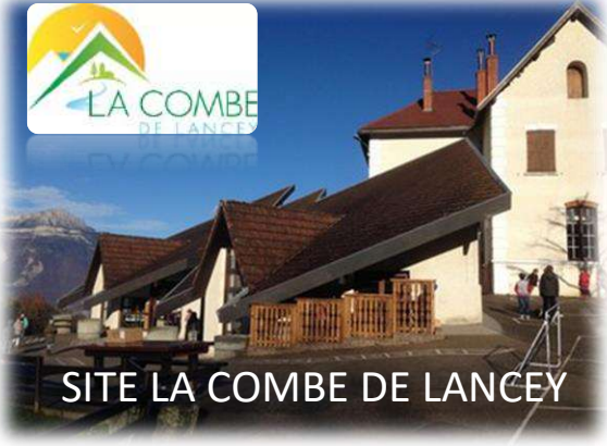
SITE LA COMBE DE LANCEY