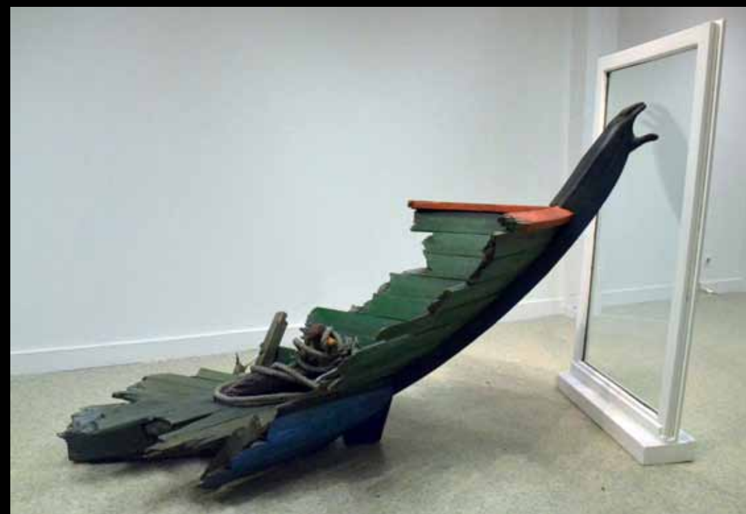
« Migration »