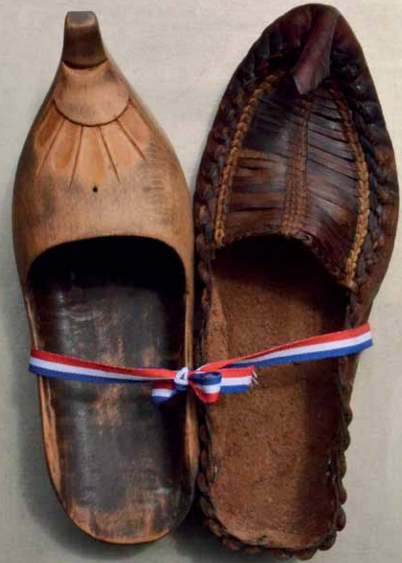
NOUS SOMMES LA SOMME DE NOUS