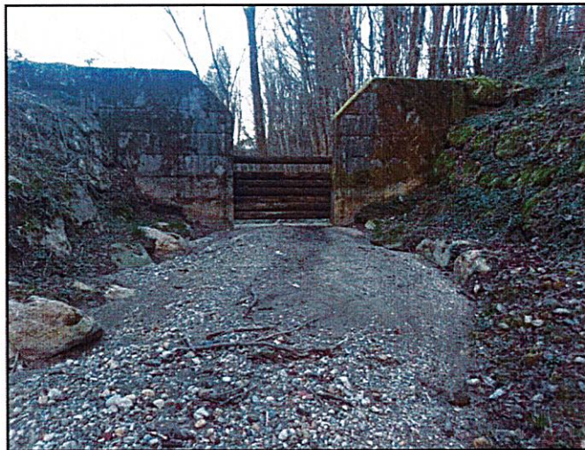
Vue vers l'aval de l'ouvrage