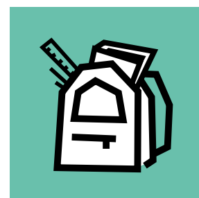
→ Les actions Conseils de Vie Collégienne (CVC)