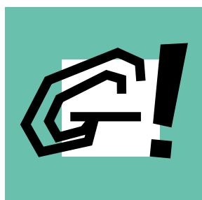
→ Les temps forts (événements animés par la CC)