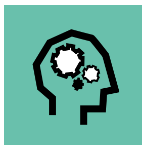
→ Les Rendez-vous « Convergence » (temps collectifs de réflexion) Destination des professionnels et acteurs associatifs du territoire